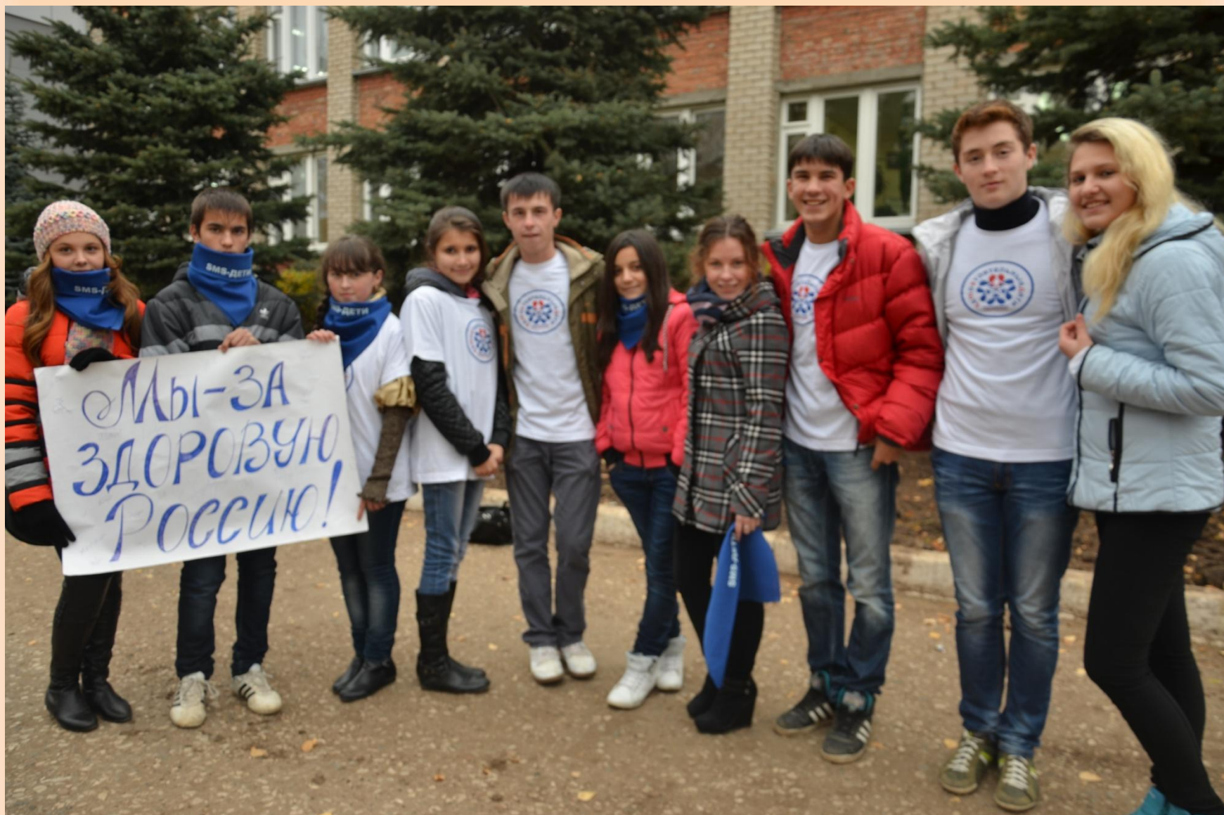
Отряд SMS дети «Вектор»