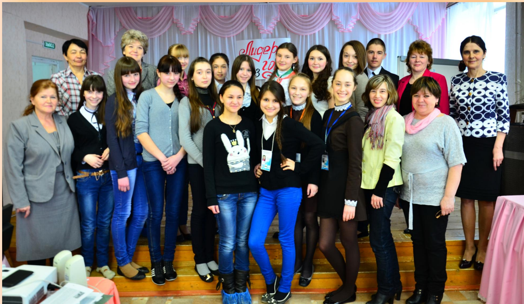
Районный конкурс «Лидер года 2013»