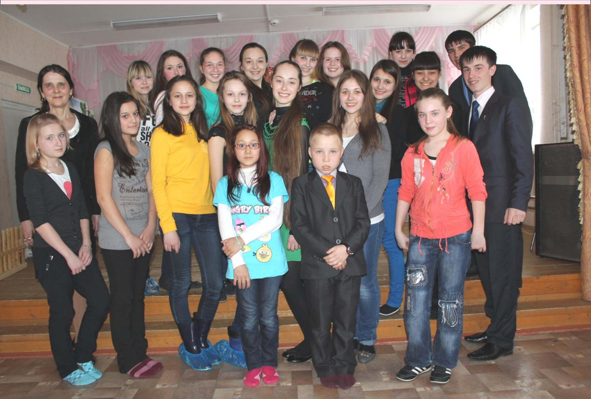
«Детская районная дума», апрель 2013